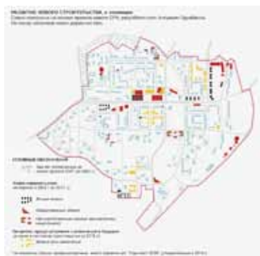
Иллюстрация 8. Застройка района в эволюции. Схема построена на основе проекта GPV, разработанного А. Грумбахом. На схему наложена новая дорожная сеть. Сведение схем в единый план: Н. В. Балухина, 2018 г.

люстрация 9), тогда как территории общественных парков сохранены в полном объеме.