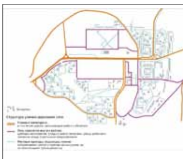
Иллюстрация 10. Реконструкция улично-дорожной сети (по топографическому плану 1976 г.). Автор Н. В. Балухина. 2019 г.