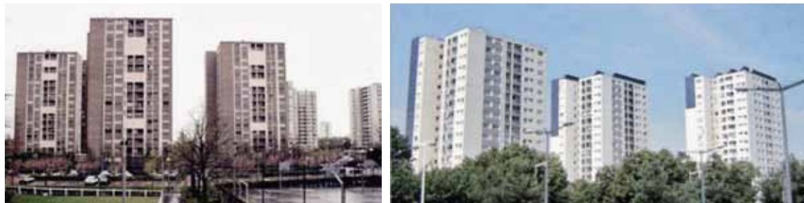
Иллюстрация 5. Пример модернизации башен квартала La Darnaise. В оригинале итальянского исследования Дж. Менеготто используется термин reabilitazione , что означает «перезаселение» или «реабилитация» [5, 249]

Стратегия возврата предусматривает конкретные мероприятия: