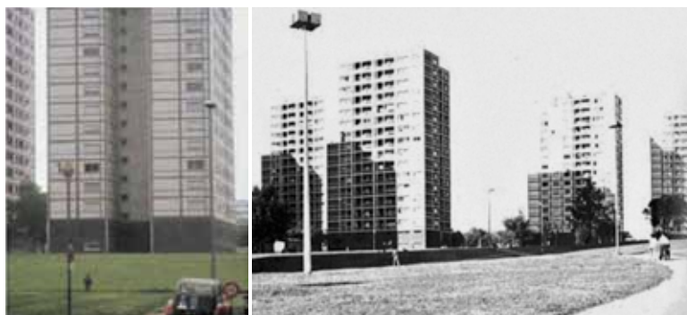
Иллюстрация 2. Фото района в период строительства [5, 243]

Программа района: территория — 200 га, 130 га — застройка жильем и сервисами. 10 тыс. квартир на 40 тыс. жителей разделены на кварталы, построенные поэтапно: Démocratie (полностью разрушен в 1994 г.); La Darnaise; Léo Lagrange; Monmousseau; Monchaud; Armstrong e Pyramide. Услуги: один крупный торговый центр и три небольших на периферии; благоустройство и озеленение, спортивные и игровые площадки; школы устроены таким образом, чтобы обеспечить детям безопасный доступ.