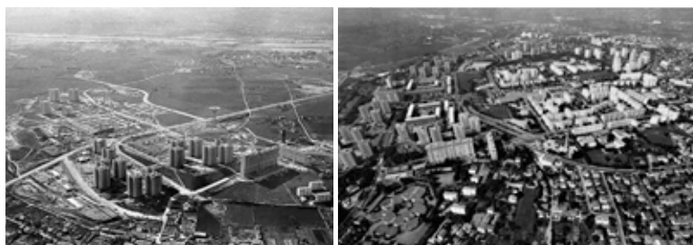
Иллюстрация 3. Вид на район Les Minguettes (рук. проектной группы арх. E. Baudoin) во время его реализации.

К концу 1970-х гг. на территории района, еще не завершено, возникают первые социальные проблемы. Законы от 1975 г. ориентируют средний класс на покупку индивидуальных жилых домов в собственность, и его представители массово покидают ZUP — районы «доступного жилья», после чего туда вселяются семьи иммигрантов (в Minguettes они говорят на более чем тридцати языках) [6, 13]. С 1979 по 1984 г. жильцами оставлено более 1 500 квартир. «Мингеты стал территорией, которая вскрыла глубокие дисфункции общества с быстрыми изменениями без предвидения и измерения последствий. Этот социальный и городской кризис нового типа побуждает власть к разработке новой политики» [6, 4].