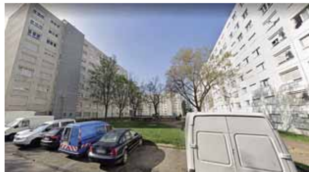
Иллюстрация 14. Результаты трансформаций УДС, состояние на июль 2019 г. Фрагмент 1: застройка 1980–1990-х гг. Структура улиц, создающая проницаемость территорий, парковки, границы полупубличных и общественных пространств