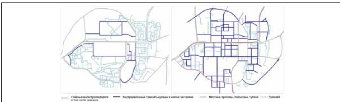
Иллюстрация 13. Результат трансформации улично-дорожной сети: слева — реконструкция сети по топографическому плану 1976 г.; справа — новая сеть с учетом текущих и будущих трансформаций — реконструкция по плану GVP 2003 г. и реализуемой программы «Horison 2013»

на нее публичными пространствами. Проницаемость территорий, согласно произведенным расчетам, увеличилась в 5 раз (Иллюстрация 13) по итогам перестройки сети за почти 50-летний период.