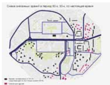
Иллюстрация 7. Схема сноса зданий, построенных в рамках проекта Grand Ensemble di Vénissieux di Lyon в 1970-х гг. Выполнено Н. В. Балухиной (2018) на основе анализа исторических документов и ресурса maps.google.com