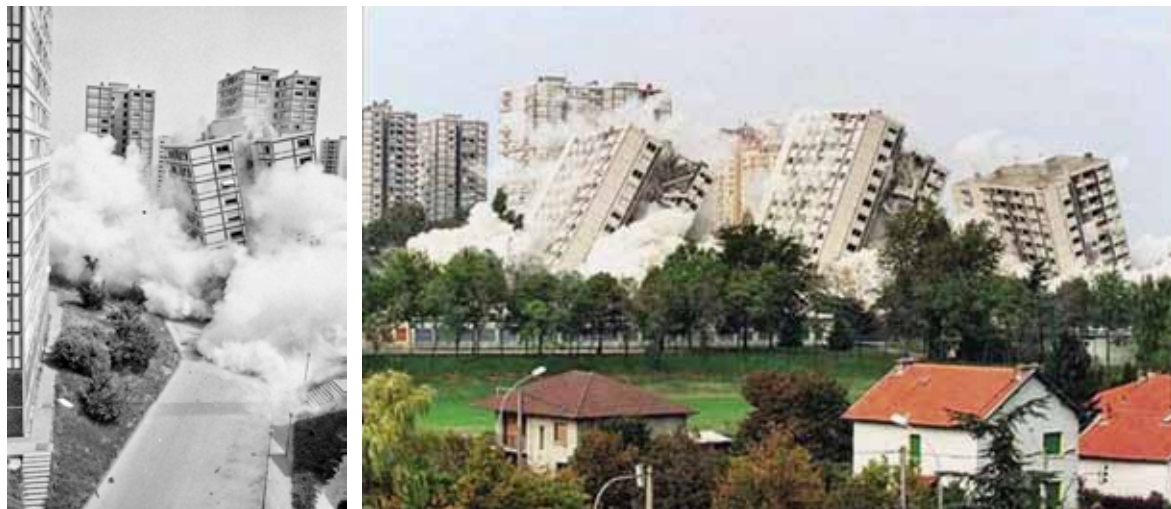
Иллюстрация 4. Снос башен квартала Démocratie. [9, 6]