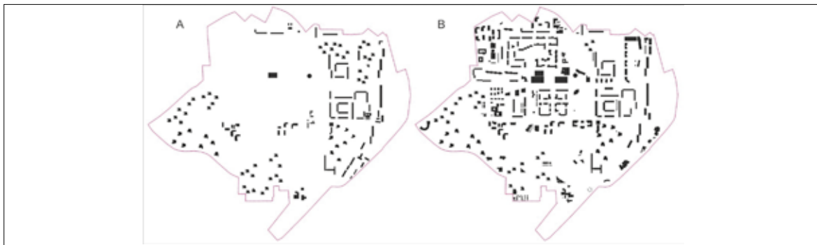
Иллюстрация 9. Результат трансформации ткани (снос, денсификация). Схема застройки: А — по топографическому плану 1976 г.; В — к настоящему моменту (на июль 2019 г., в т. ч. строящиеся здания). Автор Н. В. Балухина. 2019 г.