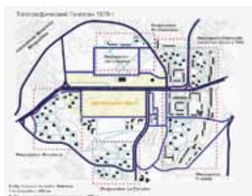
Иллюстрация 6. Топографический план 1976 г. [5, 242]. Оцифровка Н. Балухиной. 2018 г.

Результат сносов и волнового уплотнения: площадь застройки за 40 лет увеличилась в 2,3 раза (Ил-