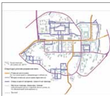
Иллюстрация 11. Улично-дорожная сеть (построена по картам Google.Maps). Октябрь 2019 г. Автор Н. В. Балухина