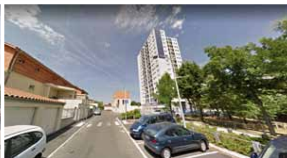
Иллюстрация 15. Результаты трансформаций улично-дорожной сети, состояние на июль 2019 г. Фрагмент 2 — застройка 1970-х гг.: башни; новые включения — малоэтажная застройка после 2010 г. Структура внутриквартальных улиц, парковки, границы полупубличных и общественных пространств