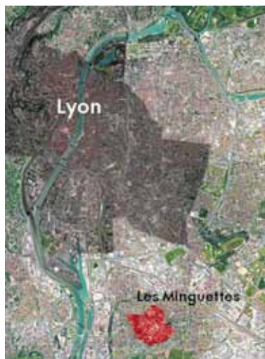
Иллюстрация 1. Жилой район Les Minguettes в структуре города. Территория участка реновации обозначена красным цветом