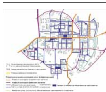
Иллюстрация 12. Схема улично-дорожной сети, предусмотренная GVP (2003) на перспективу. В настоящий момент в стадии реализации (на основе схемы А. Грумбаха [5, 255])